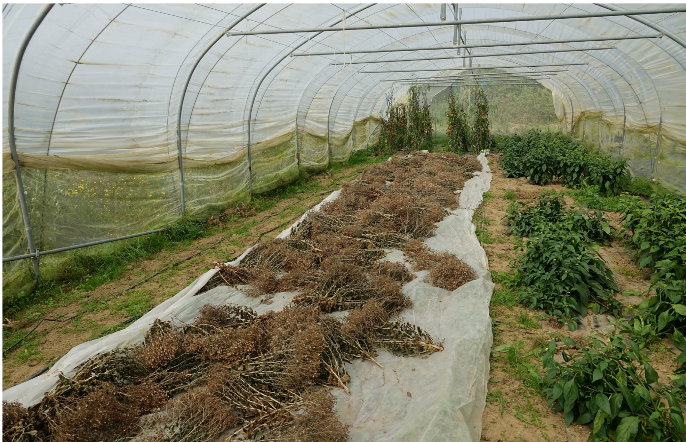
Figure 9. Séchage primaire de laitues porte-graines en tunnel chez CET SC.

Par ailleurs, la société Zollinger entrepose régulièrement des semences en tunnel pour effectuer un séchage sur bâche, et cela ne semble poser aucun problème. Il est en tous cas essentiel d'étaler les plantes en fine couche et de bien les retourner pour éviter une montée en chaleur des semences dans un milieu confiné et humide. Notons qu'il est possible d'étaler des semences sur des draps, eux mêmes placés sur des vieux sommiers de matelas pour assurer une meilleure circulation de l'air.