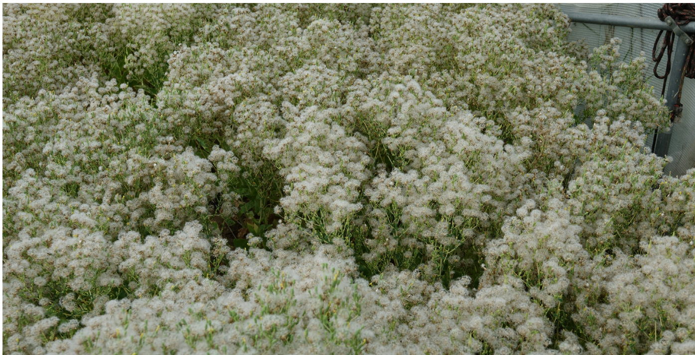
Figure 4. Porte-graines de laitue prêts à être récoltés.

Dans le cas d'une floraison échelonnée, le défi est de trouver le meilleur moment pour maximiser la qualité des semences et la quantité récoltée. Il est généralement indiqué de récolter lorsque les premières semences commencent à tomber (Deppe, 2000), mais quelques subtilités existent selon les espèces. Par exemple, les plants de mâche peuvent être fauchés dès que les toutes premières semences tombent à terre, alors qu'il est recommandé de récolter les plants de laitue lorsque deux tiers des aigrettes surmontant les akènes sont ouvertes (voir Figure 4).