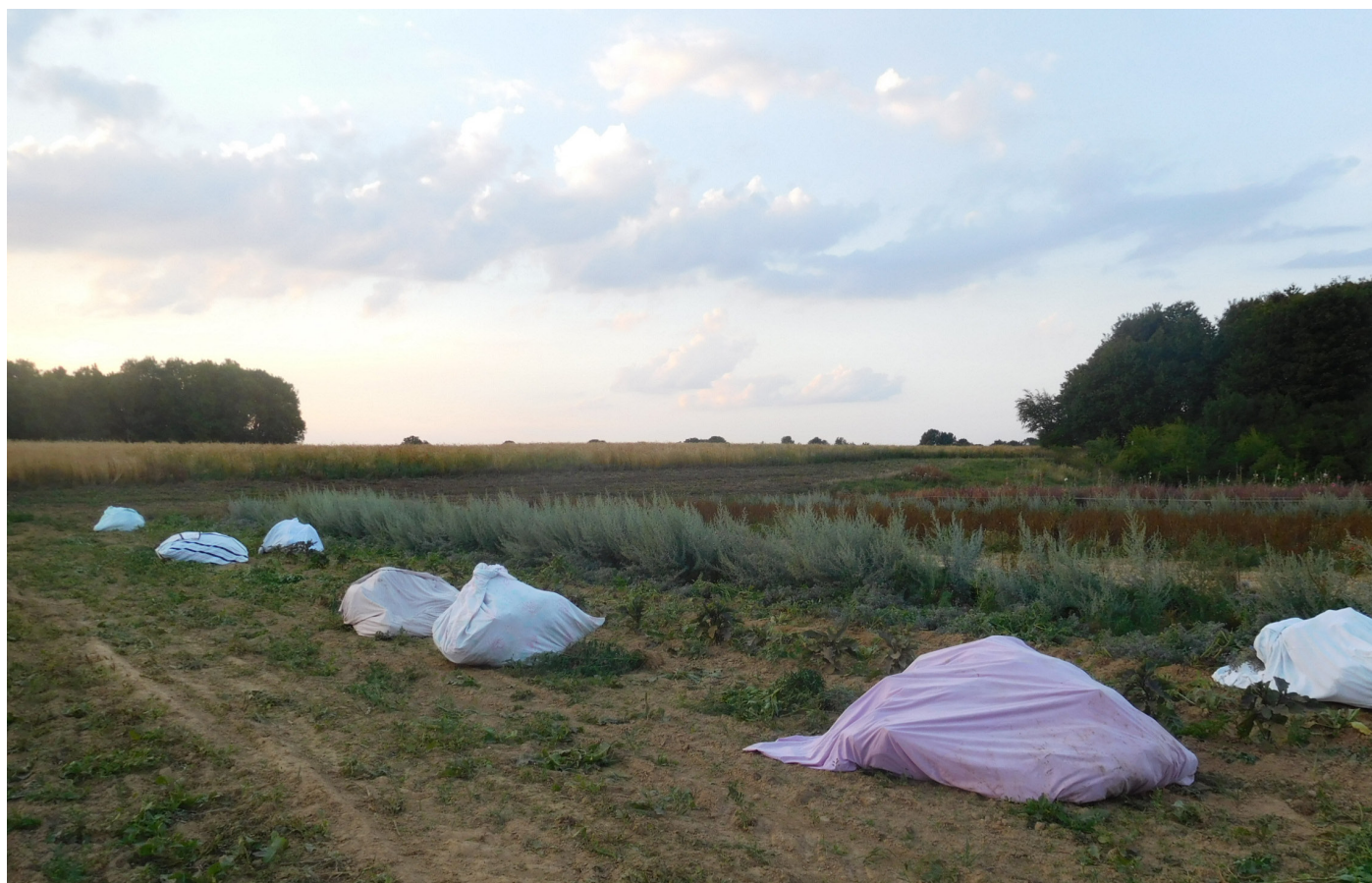
Figure 13. De vieux draps de lit peuvent être utiles pour transporter des porte-graines volumineux.

Chaque espèce a des caractéristiques particulières. Par exemple, le panais est photosensibilisant : se protéger la peau est indispensable pour éviter de douloureuses brûlures. D'autres plantes sont pourvues de piquets et il faut donc également s'en protéger. Les vêtements de travail doivent donc être adaptés à la situation.