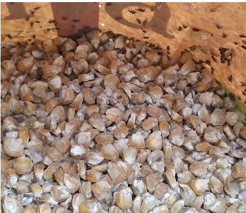
Figure 17. Charançons dans un lot de semences de maïs. À ce stade d'infection, on entend les insectes à distance du sachet.