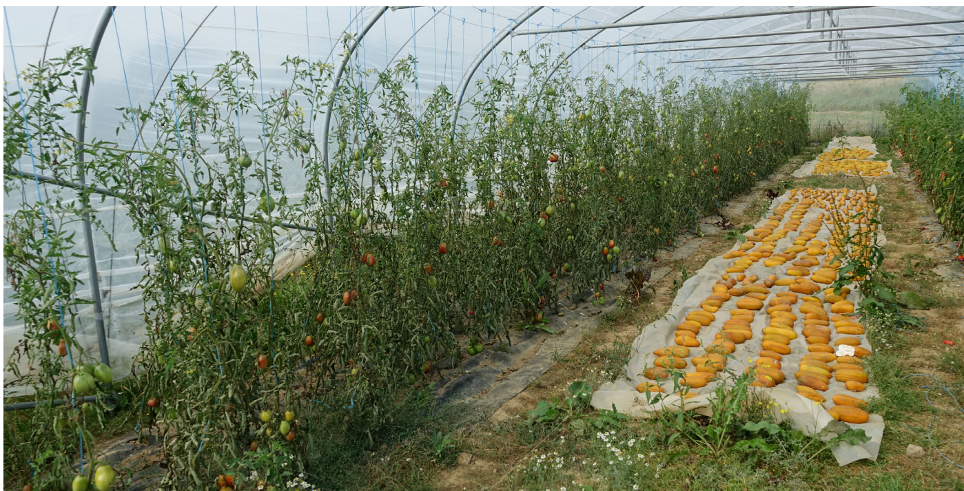
Figure 5. Récolte de cornichon « Vert Petit de Paris ». Ceux-ci continuent à maturer quelques jours en tunnel avant l'extraction des semences.