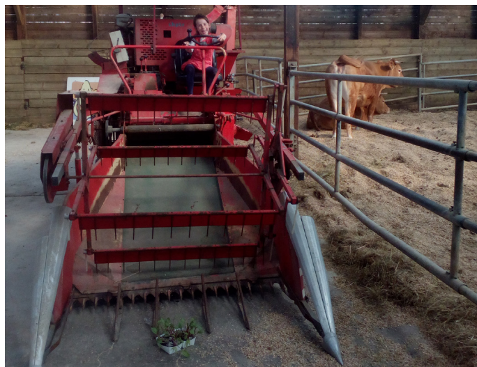
Figure 15. Moissonneuse-batteuse d'essai de la marque Hege 125C. Ce type de moissonneuse, bien que difficile à trouver, présente l'avantage d'être abordable financièrement. Vu l'âge de ces machines, de nombreuses pannes peuvent survenir. Elles sont cependant réparables.