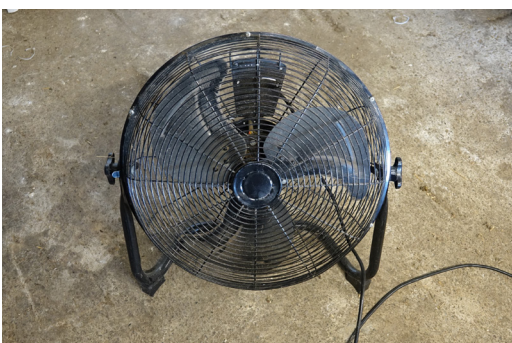
Figure 16. Ventilateur de 40 cm de diamètre. Le séchoir de gauche sur la Figure 11 est conçu sur base de ce modèle.

L'utilisation de ventilateurs orientés vers les plantes étalées sur des bâches en intérieur permet de brasser beaucoup d'air et d'accélérer le séchage. Plus les ventilateurs sont gros, plus ils sont efficaces. Un diamètre de 40 cm semble être un minimum (Figure 16).