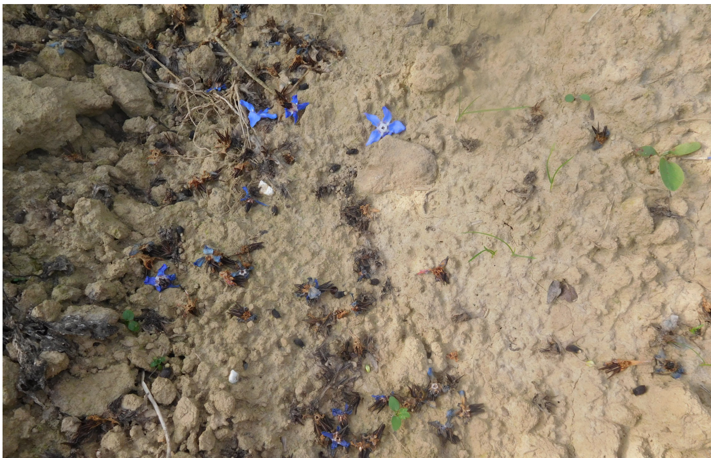
Figure 12. Semences de bourrache tombées à terre : si on attend trop, le degré d'égrenage est élevé. Cela implique des pertes de rendement et des semis spontanés indésirables.

Ces risques peuvent être anticipés de différentes manières. La période de plantation, le choix d'espèces adaptées à la région, la mise en culture de variétés robustes, l'utilisation d'infrastructures adaptées et les pratiques agricoles doivent être déterminés attentivement pour réduire le risque de pertes. Le document « Weather-Related Risk Reduction Guidelines for Dry-Seeded Specialty Seed Crops - Preventing loss from adverse weather during seed maturation and harvest » (2006) de l'Organic Seed Alliance approfondit chacune de ces pistes.