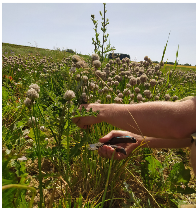
Figure 6. Récolte de semences de ciboulette en moyenne culture à l'aide d'un sécateur.

Nous conseillons de systématiquement couper les tiges plutôt que de les arracher, afin d'éviter d'importer de la terre et des cailloux attachés aux racines dans les lots de semences. Ces éléments inertes sont en effet souvent impossibles à extraire du lot au moment du triage et leur présence risque donc de nuire à la qualité.