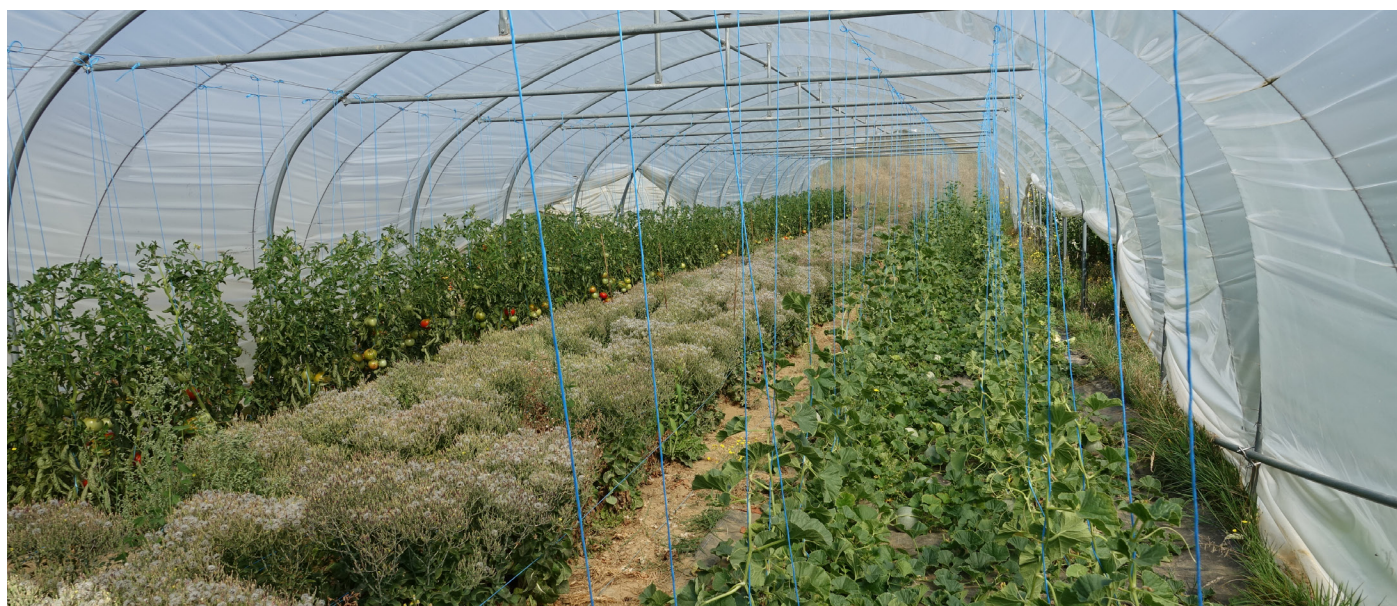
Figure 2. Cultures de porte-graines en tunnel.

La Figure 2 montre des cultures en moyenne surface et la Figure 7 donne un exemple de grande culture.