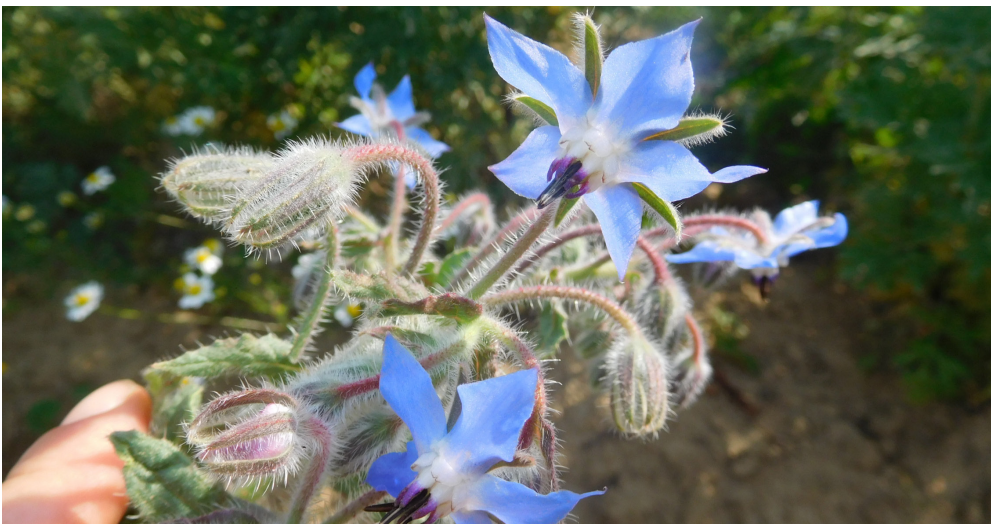
Figure 3. La floraison de la bourrache est très échelonnée : on observe ici des fleurs ouvertes et des bourgeons en développement sur une même tige. La maturation des graines est échelonnée comme la floraison.

Par exemple, les soucis ( Calendula sp.) ont une floraison très échelonnée, qui peut durer plusieurs mois. Les semences vont donc mûrir au fur et à mesure et il ne sera pas possible de les récolter toutes en même temps. Au contraire, les pois auront tendance à fleurir sur un laps de temps assez court, s'ils ne sont pas récoltés pour être consommés. La récolte des semences peut être réalisée en une seule fois, car l'ensemble des semences sera mature simultanément.