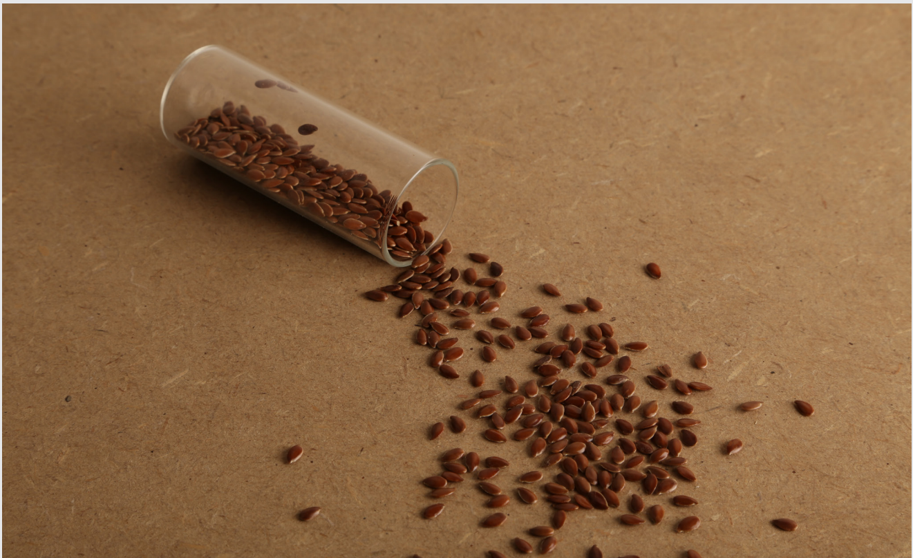
Figure 1. Semences de lin.

Notons que ce dossier peut être abordé de manière linéaire, ou en piochant ici et là des informations précises. Les sections 2 et 3 présentent les bases, tandis que les sections 5 et 6 détaillent le matériel et la conservation.