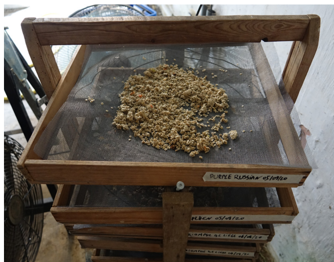
Figure 10. Séchage de semences de tomates en claies.

Les petites quantités de semences extraites de légumes-fruits peuvent être séchées en claies, comme illustré à la Figure 10. Cette méthode comporte néanmoins le risque de mélange de lots, si différents lots sont empilés les uns au-dessus des autres. Cela nécessite donc des précautions particulières. Les semences sèches étant plus légères que les semences humides, il convient notamment de rester attentif à ce qu'elles ne s'envolent pas lorsqu'elles sèchent. Il est conseillé de remuer régulièrement le lot pour éviter que les semences ne se collent entre elles et pour favoriser un séchage homogène et plus rapide.