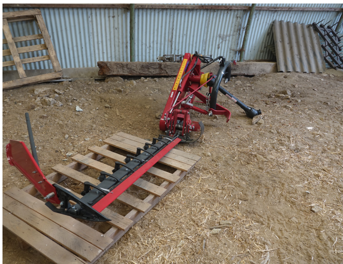
Figure 14. Faucheuse utilisée dans CET SC.

Enfin des entreprises spécialisées élaborent des outils spécialisés pour la récolte de légumes. Certains d'entre eux pourraient être utiles dans le cadre de la production de semences. À titre d'exemple, la société Terrateck propose des équipements qui pourraient éventuellement être utiles ( Terrateck - Spécialiste du matériel de maraîchage diversifié , s. d.). Nous pensons par exemple à la récolteuse à mesclun Quick Cut Greens Harvester ou aux récolteuses de jeunes pousses, qui pourraient être utiles pour récolter des semences sur des petits porte-graines, comme la claytone de Cuba, le pourpier ou la mâche. Ces machines gagneraient à être testées.