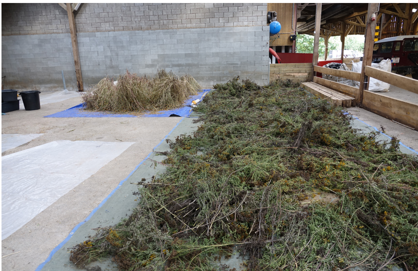
Figure 8. Séchage de semences de tanaisie et de tagètes en hangar, en attendant le triage.

Pour réaliser un séchage primaire sous abri , il suffit d'étaler les semences sous un toit pendant une durée relativement longue. Le strict nécessaire à avoir est donc un lieu où les récoltes peuvent être étalées pendant leur séchage. Cela peut être dans un hangar (Figure 8), ou un tunnel. De petites quantités peuvent être stockées dans un grenier bien aéré. Ce lieu ne doit idéalement pas être soumis à de trop hautes températures 9 pour maintenir une bonne qualité des semences et la présence d'oiseaux ou de rongeurs doit également être surveillée.