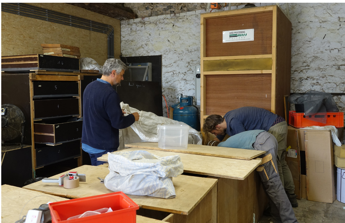
Figure 11. Séchoirs utilisés chez CET SC.

En pratique, au sein de CET SC, les trois types de séchoirs (claires, séchoir auto-construit et « grand » séchoir) étaient utilisés. Cette combinaison d'échelles était confortable.