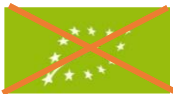
Exemple 3 : Produit en conversion