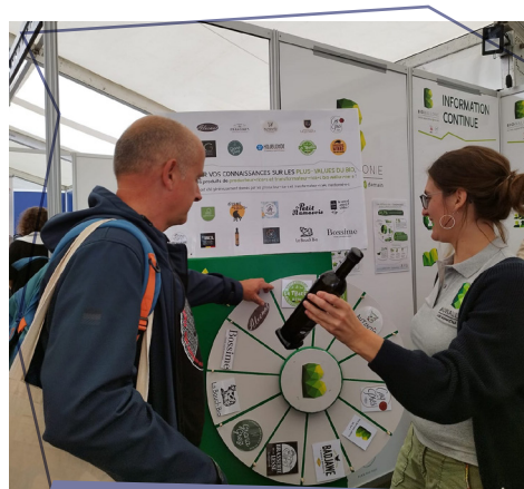
Animation « La roue du bio » : durant les Foires de Libramont (juillet 2023) et Battice (septembre 2023), nous avons proposé un quiz sur les plus-values du bio, à l'issue duquel les participant·e·s pouvaient remporter un produit bio wallon. Une bonne manière de valoriser les produits bio de notre terroir !

• Rédaction des chiffres du bio 2022 6 . Comme chaque année, Biowallonie épluche les statistiques bio de l'année précédente, autant au niveau de la production que de la consommation bio en Wallonie, en Europe et dans le Monde et ce, en partenariat avec l'Observatoire de la Consommation de l'APAQ-W (qui analyse et rédige la partie consommation).