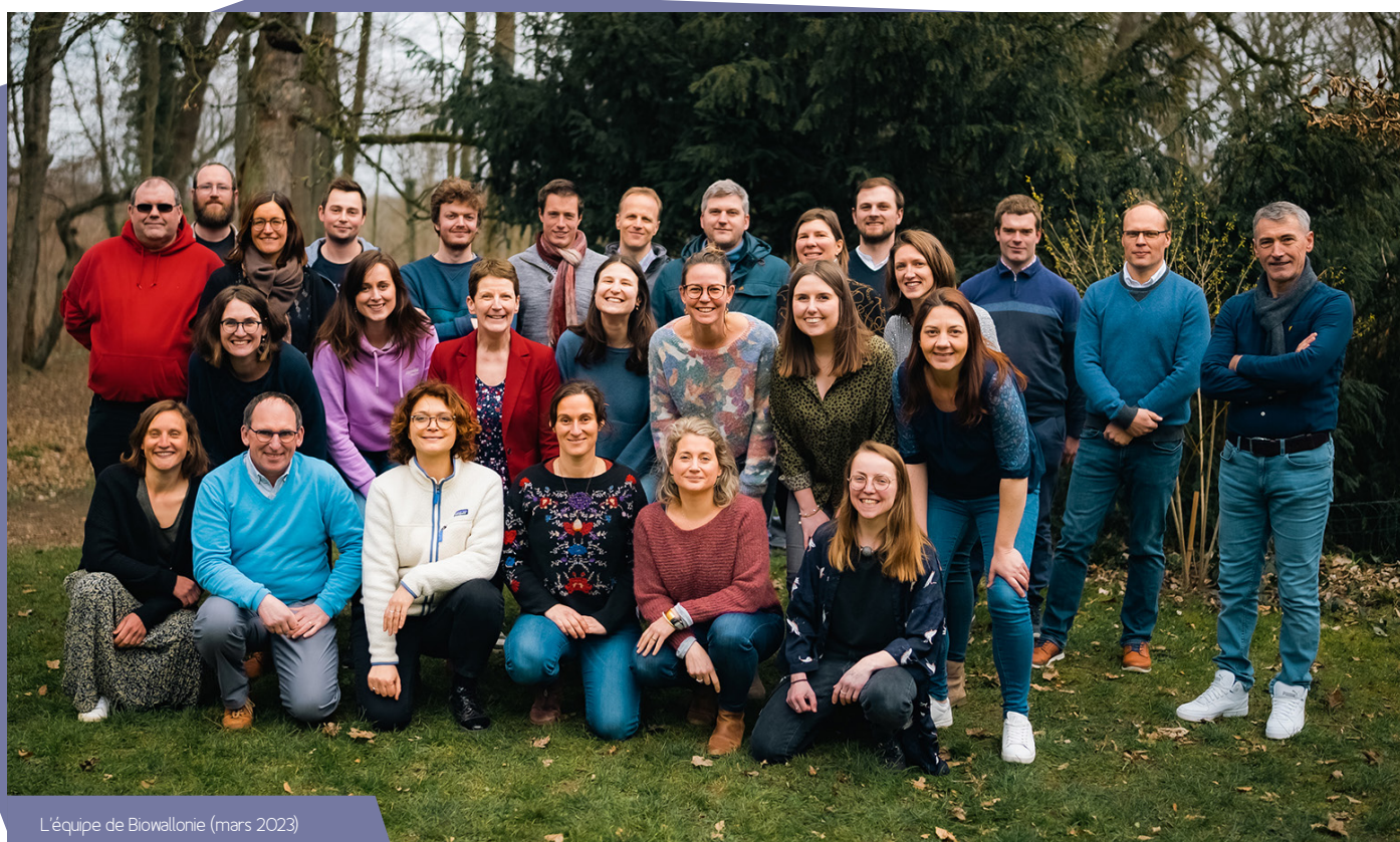
L'équipe de Biowallonie (mars 2023)

Biowallonie reste cette année, encore et toujours, à vos côtés et se mobilise pour dynamiser les débouchés bio !